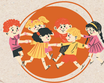
Tout cela en s'amusant

Des projets bien menés avec plus de 8 000 € distribués pour les voyages, activités et sorties scolaires l'an dernier.