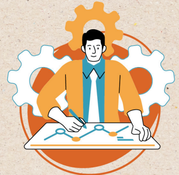
Vos talents mis en avant